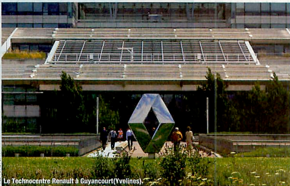
Le Technocentre Renault à Guyancourt (Yvelines).